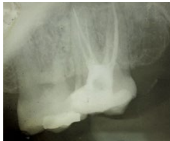
Slika 4. Definitivna opturacija zuba 17 sa pet korijenskih kanala

Poslije ispitivanja inicijalne prohodnosti kanala K-turpijom #10 (Dentsplay Maillefer, Ballaiges, Švajcarska) radna dužina kanalne preparacije određena je apeks lokatorom (Raypex® 5, VDW, GmbH, Minhen, Nemačka). Kanali korijena su instrumentisani Gliden-Gates svrdlima (Dentsplay Maillefer, Ballaiges, Švajcarska) i K-turpijama (Dentsplay Maillefer, Ballaiges, Švajcarska) modifikovanom tehnikom dvostrukog konusa. Poslije svakog instrumenta kanal korijena je ispran sa 2 ml 1% natrijum hipohlorita. Po završenoj hemomehaničkoj obradi kanali su isprani 10% rastvorom limunske kiseline, a zatim sa 2 ml 1% natrijum hipohlorita i posušeni sterilnim papirnim poenima. Za interseansnu medikaciju korišćen je preparat na bazi kalcijum hidroksida (Calxyl, OCO Products, Dirnstein, Njemačka) i kavitet je privremeno zatvoren sa glas jonomer cementom (Fuji IX, GC, Tokio, Japan). Poslije 15 dana i uklanjanja interseansnog medikamenta, određeni su glavni gutaperka poeni (Slika 3) i kanali su opturirani modifikovanom monokonom tehnikom uz primjenu paste AH26 (Dentsply, DeTrey, GmbH, Konstanz, Njemačka) i gutaperka poena (Slika 4). Restaurativni ispun postavljen je nakon 2 dana.