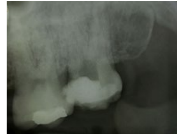
Slika 1. Dijagnostički radiogram zuba 17

Poslije obezbjeđivanja suvog polja rada, operativno područje uključujući i kunicu zuba dezinfikovani su sa 2% hlorheksidinom. Aplik-